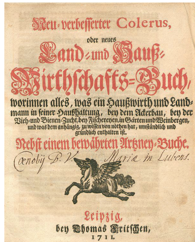
Il. 1. Strona tytułowa poradnika Neu-verbesserte Colerus z inskrypcją własnościową klasztoru w Lubiążu (Biblioteka Uniwersytecka we Wrocławiu, Oddział Starych Druków, sygn. 902298)

Most of these works were written in German, or they were translated into this language but were originally treatises written in Latin, Italian and French. For example, a treatise on agronomy by Pietro de Crescenzi was published in Latin in 1538 in Basel [8]. There are also two examples in Italian of the same text, one published in Venice in 1542, the other published in Florence in 1605.