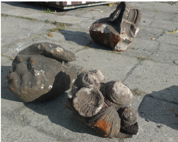
Il. 3. Ornamenty muszlowe i fragment filaru Fig. 3. Shell ornaments and fragment of the pillar