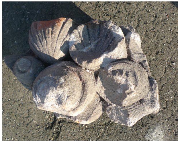
Il. 4. Fragment ornamentu muszlowego Fig. 4. Fragment of shell ornament

Neptuna (il. 1) 6 , dwa fragmenty draperii okrywającego go płaszcza, fragment brody bądź włosów tejże postaci, fragment przedramienia, trzy fragmenty kanelowanych, zwieńczonych wolutą pilastrów (il. 2, jeden z nich na il. 3), trzy żłobione wewnętrzne fragmenty misy fontanny, dwa fragmenty dekoracji floralnej oraz dwa – dekoracji w formie muszli (il. 4), a także rzeźbiarskie, większe przedstawienie muszli konchowej.