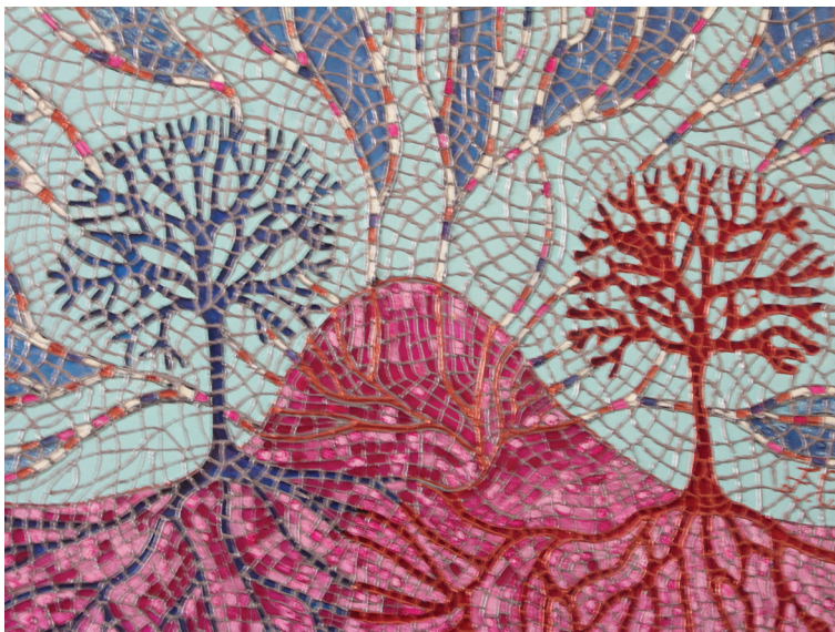
Kontakt, mozaika szklana, autor Ewa Cisek Contact, glass mosaic by Ewa Cisek