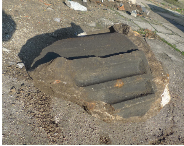
Il. 2. Detal architektoniczny filaru Fig. 2. Architectural detail of the pillar