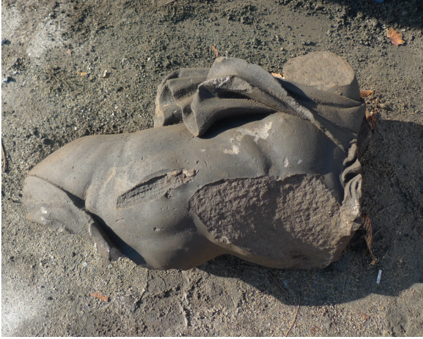
Il. 1. Tors postaci Neptuna Fig. 1. Torso of Neptune