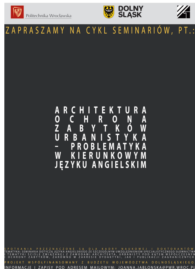
Il. 3. Plakat zapraszający na seminaria (wyk. J. Jabłońska, 2013)

The seminars organized by the Faculty of Architecture for academic teachers and doctoral students were very successful. Owing to the openness of the participants and the stress-free studying environment, it was possible, to