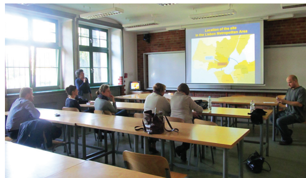
II. 2. Spotkanie w cyklu I

Fig. 1. Meeting in the second series – lecture by Professor Alina Drapella-Hermansdorfer