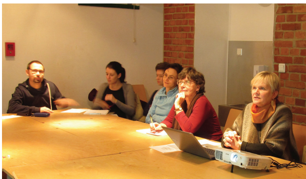
II. 1. Spotkanie w cyklu II