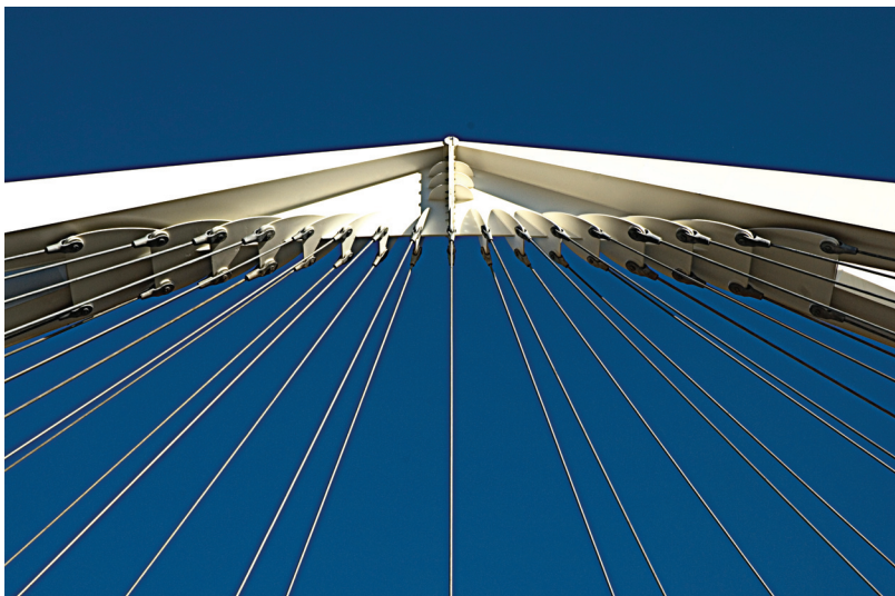
Kładka dla pieszych na autostradzie A13 koło Bolonii – węzeł podwieszenia ciągien

The foot-bridge over A13 highway near Bologna – the node of tension members suspension