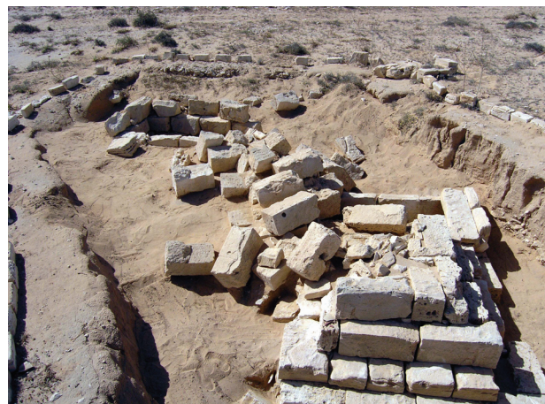
Il. 4. Marina El-Alamein. Zwalony grobowiec T12 przed anastylozą

Wciąż pozostają pomniki nieodbudowane. Z nich stosunkowo najbliższa realizacji jest anastyloza najbardziej rozbudowanego filara z czterema półkolumnami, z którego zachowane są liczne elementy. Problemem jest znaczne zniszczenie i braki wielu elementów stanowiącego podstawę skrzynkowego grobowca. Z pozostałych odkrytych, a nie odbudowanych monumentów uchowały się skromne pozostałości. W związku z tym, oczywiście poza teoretyczną, zgodną z zasadami konserwacji zabytków rekonstrukcja nie jest możliwa. Niemniej nawet obecnie odbudowana malownicza grupa pięciu pomników, z daleka widocznych na tle morskiej laguny, ma silną ekspresję plastyczną i jest odbierana jako główny zabytek stanowiąca w Marinie El-Alamein.