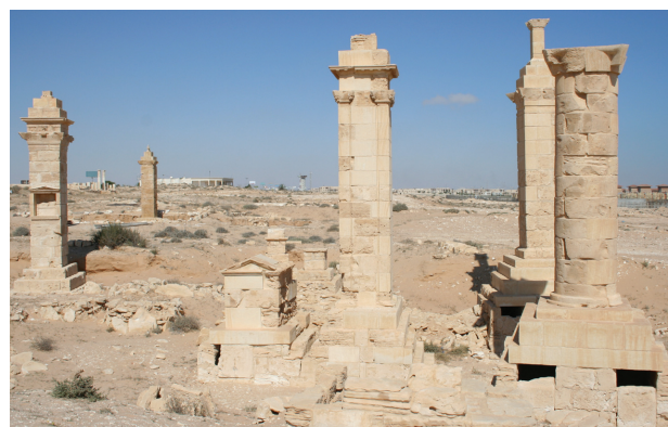
Il. 2. Marina El-Alamein. Grupa pomników grobowych T1K, T12, (T1C), T1B, (T2, T3), T1 i T1F

Pillar tombs T1K and T12 after anastylosis