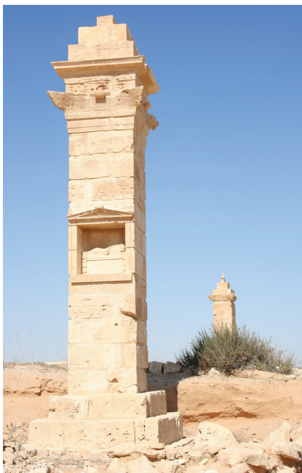
Il. 1. Marina El-Alamein.

The construction concept of the design of the monument is obvious. However, it affects not only the proportions but also – to a limited extent – its repetitive size. Its basic building element is a typical 32 \times 32 \times 64 cm limestone block, which roughly corresponds to 1 \times 1 \times 2 in Ptolemaic feet. The dimensions of this basic building material along with the measurement unit of feet (sometimes larger, up to about 34 cm) decreased in Roman times to the multiplication of about 29.6–30 cm and such blocks were used in the buildings from the area of the city as well as in younger monuments from the necropolis. Four basic blocks were used for the layer of the structure of the pillar which was square in plan, placed in it like