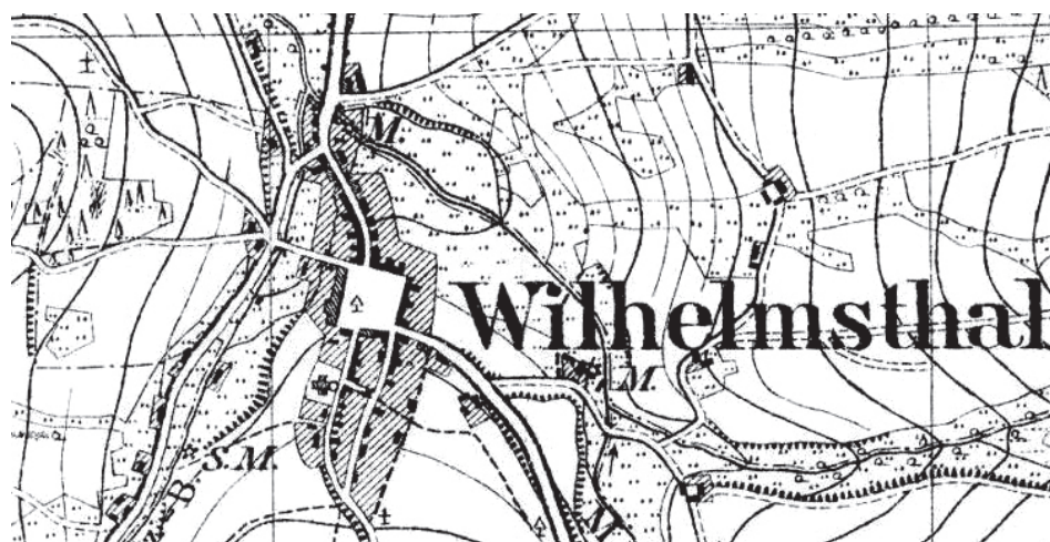
Fig. 1. Bolesławów. A fragment of the topographic map in scale 1:25 000 from 1936. A copy without scale