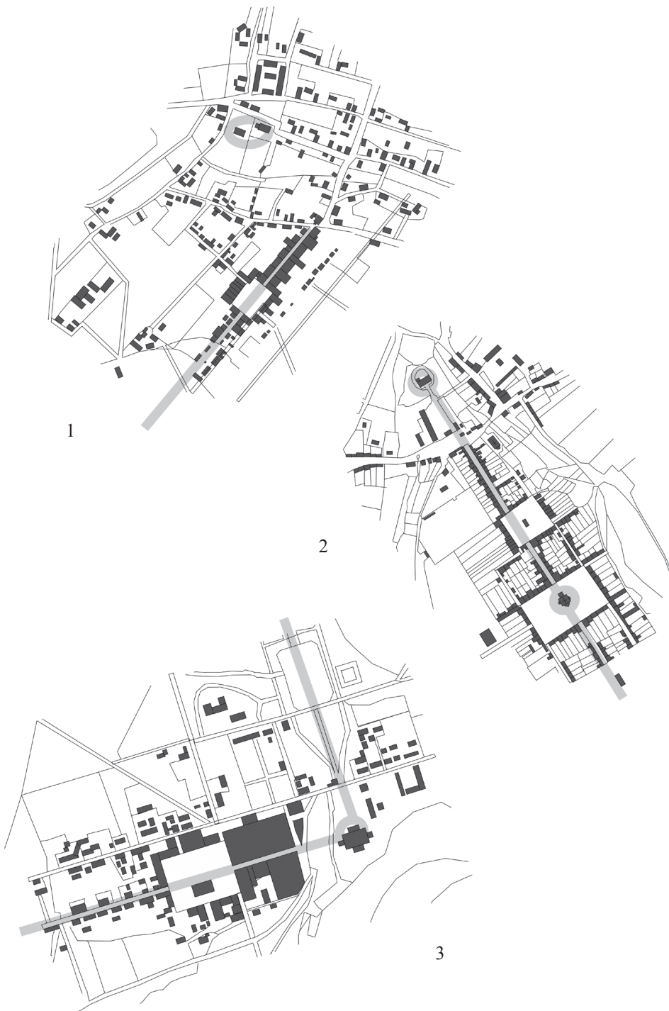
II. 5. Rozplanowanie miast o osiowych układach barokowych na Dolnym Śląsku. Na szaro zaznaczono główne elementy kompozycji urbanistycznej; osie i węzły. 1. Dobroszyce, 1663, 2. Twardogóra, około 1685, 3. Brzeg Dolny, 1662.

Opracowanie autorki na podstawie planów topograficznych z XIX i początku XX w.