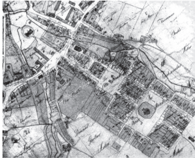
Il. 2. Plan Twardogóry według F. Grapowa z 1811 r. [17, s. 44]