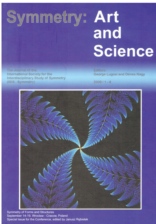
Il. 1. Okładka publikacji prezentującej materiały z konferencji „Symmetry of Forms and Structures”

Fig. 1. Cover of the publication containing conference proceedings of the “Symmetry of Forms and Structures”