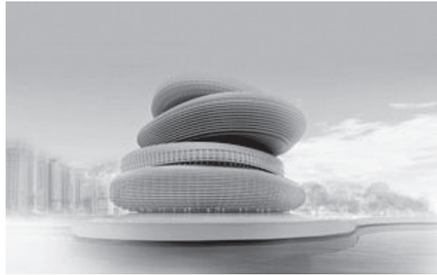
Il. 3. Praca konkursowa, autor: PRAUD

Fig. 2. Competition entry; author: Volgemut Architects