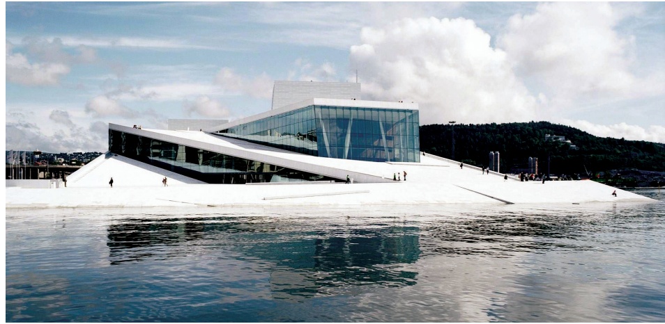
Fig. 1. Opera house in Oslo by architectural studio Snøhetta as the city square

Współcześnie liczne programy rewitalizacji terenów przemysłowych starają się powtórzyć „efekt Bilbao” 4 . Projekt Muzeum Guggenheima wprowadził nowe wartości kulturowe mające wpływ na życie społeczne i ekonomiczne miasta. Spektakularna, ekstrawagancka architektura budynku stała się jednym z najczęstszych powodów licznych wizyt turystów [5]. Muzeum zostało wykorzystane jako narzędzie rewitalizacji zdegradowanej przestrzeni. Po dekadzie od jego otwarcia miasta na całym świecie budują muzea w nadziei na powtórzenie sukcesu Guggenheima jako motoru rozwoju turystyki, rewitalizacji i lokalnej dumy [7].