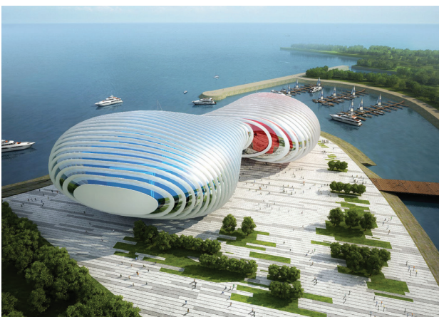
Il. 4. Praca konkursowa, autor: Peter Ruge Architekten [14]

The last composition occurs definitely less frequently. A mixed system is the one in which there is a balance between elements representing a geometric and organic