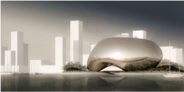
Il. 2. Praca konkursowa, autor: Volgemut Architects

Fig. 2. Competition entry; author: Volgemut Architects