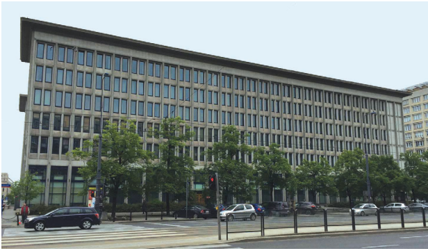
Il. 4. Budynek sądu przy ul. Marszałkowskiej 82