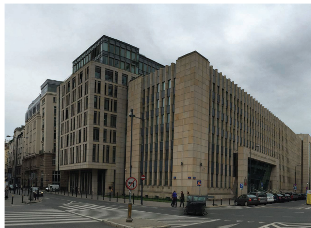
Il. 9. Budynek Naczelnego Sądu Administracyjnego w Warszawie

W latach 2006–2009 trwały prace nad rozbudową – według projektu warszawskiej pracowni S.A.M.I. – o nową część mieszczącą Wojewódzki Sąd Administracyjny [12]. Budynek liczy ponad 9500 m 2 powierzchni użytkowej. Kubaturę tworzą trzy bryły, jedna pięciokondygnacyjna i dwie dziewięciokondygnacyjne. Wejście główne do obiektu zlokalizowane jest od ul. Boduena. Forma kolumnady zwieńczonej napisem wrytym w kamieniu bezpośrednio nawiązuje do gmachu Sądu Grodzkiego przy al. Solidarności. Projektanci w ten sposób opisują architekturę budynku: Dwie ostatnie kondygnacje budynku wycofano do lica dwukondygnacyjnej bazy i wykończono fasadami przeszklonymi z kamiennymi i szklanymi aplikacjami. Budynek od strony ulicy Jasnej i Boduena ukształtowano w linii przebiegu pierzei ulicy. Od strony ulicy Szpitalnej, wysuwająca się bryła zamyka swym widokiem Plac Powstańców Warszawy [13]. Nowo powstała część sądu niczym się nie wyróżnia na tle innych budynków. Jest poprawna, ale nie porywająca (il. 9). Wpisuje się w kontekst, jednak nie niesie ze sobą żadnej