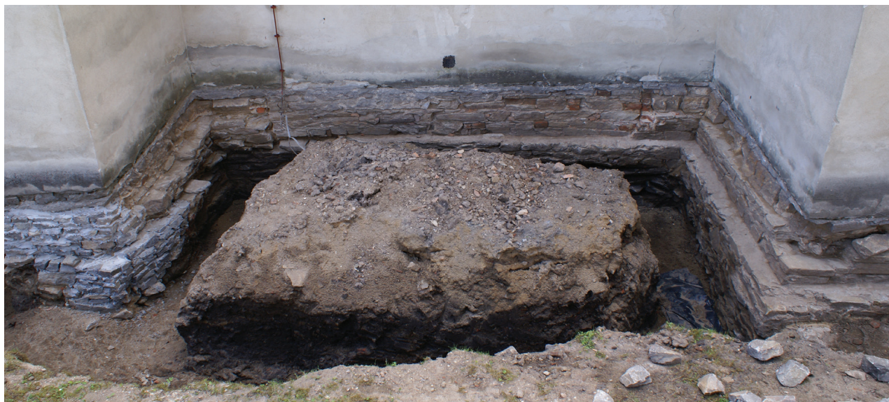
Il. 3. Relikwiarz kaplicy dostawianej od północy do trzeciego od zachodu przeszle północnej nawy bocznej kościoła (fot. E. Łużyniecka, 2008)

Kolejnym odkrytym elementem było lico muru odsłonięte w północnym profilu wykopu drenażowego, zlokalizowanego przy czwartym od zachodu przeszle omawianej wcześniej północnej nawy bocznej kościoła. Mur ten został wzniesiony z niechlujnie ułożonych kamieni i stanowił prawdopodobnie część obudowy zniszczonego kanału.