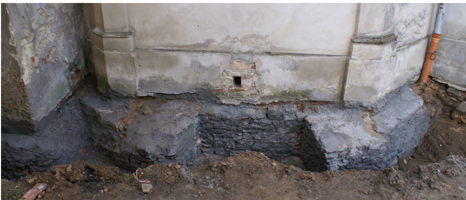
Il. 5. Relikt kaplicy z trójbocznym zakończeniem przy wschodniej ścianie kaplicy św. Józefa

Fig. 4. Relics of buttresses uncovered near the Holy Cross Chapel