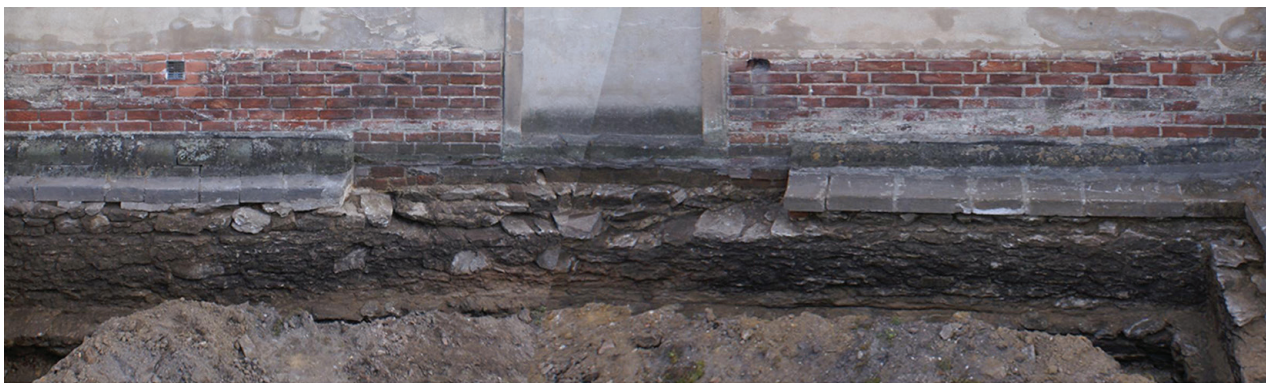
Il. 2. Północna ściana północnego ramienia transeptu z relikw porta mortuorum

The third sub-type of the wall along with the plinth was preserved in the first western bay of the northern aisle. At