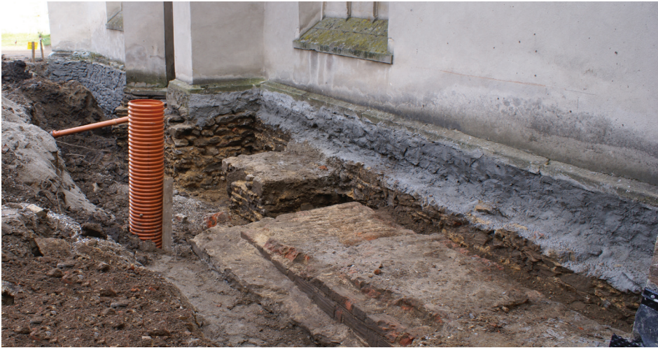
Il. 4. Relikty przypór odsłonięte w pobliżu kaplicy Świętego Krzyża

Fig. 4. Relics of buttresses uncovered near the Holy Cross Chapel