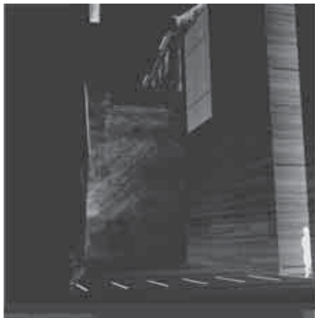
Il. 4. Kaplica ekumeniczna – nocna iluminacja Fig. 4. Ecumenical chapel – night illumination