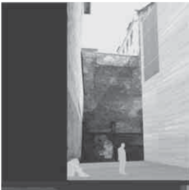
Il. 3. Kaplica ekumeniczna – widok w świetle dziennym Fig. 3. Ecumenical chapel – daylight view