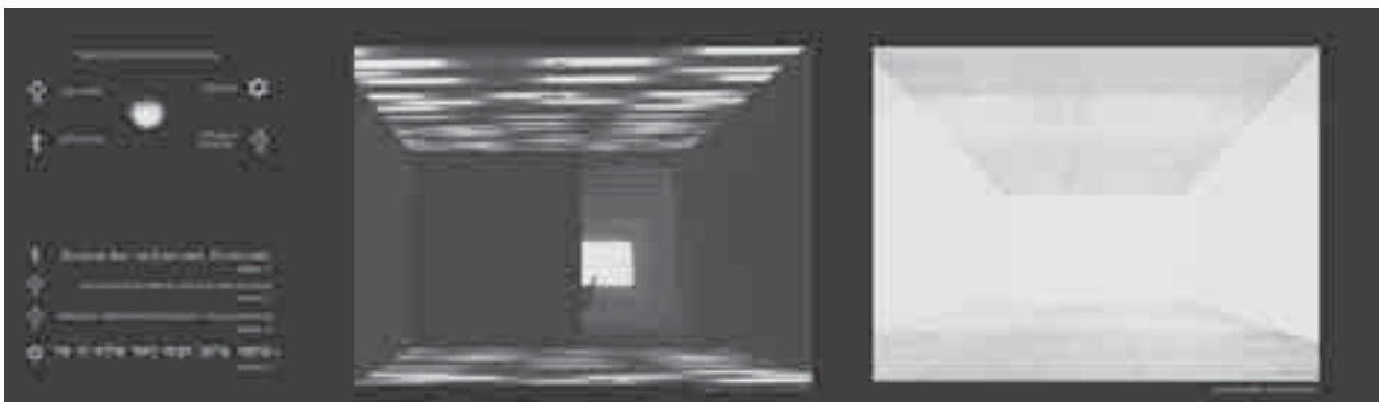
Il. 5. Światło – uniwersalny symbol w kaplicy ekumenicznej Fig. 5. Light – universal symbol in the ecumenical chapel

monolityczną ścianę kurtynową oraz właściwą bryłę kaplicy. Gdy wchodzimy w mroczną przestrzeń wykończoną czarnym granitem, naszym oczom ukazuje się biała rozświetlona kostka zawieszona w ciemnej przestrzeni.