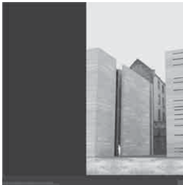
Il. 2. Ścieżka – kadr na Centrum Dialogu Fig. 2. Path – view of the Centre of Dialogue

od idei urbanistycznej, na doborze materiałów kończąc, zgodnie z tym co powiedział Tadao Ando: Architecture has forgotten that the space can be a source of inspiration („Architektura zapomniała, że przestrzeń może być źródłem inspiracji” – tłum. aut.) [1, s. 9].