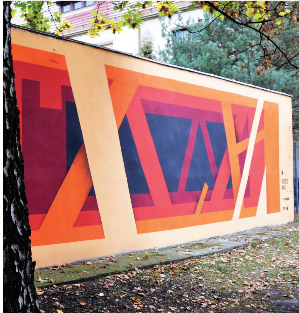
Il. 1. Patryk Ślusarski, Kompozycja geometryczna , Wydział Architektury PWr, ul. B. Prusa, Wrocław 2015 (fot. P. Ślusarski)