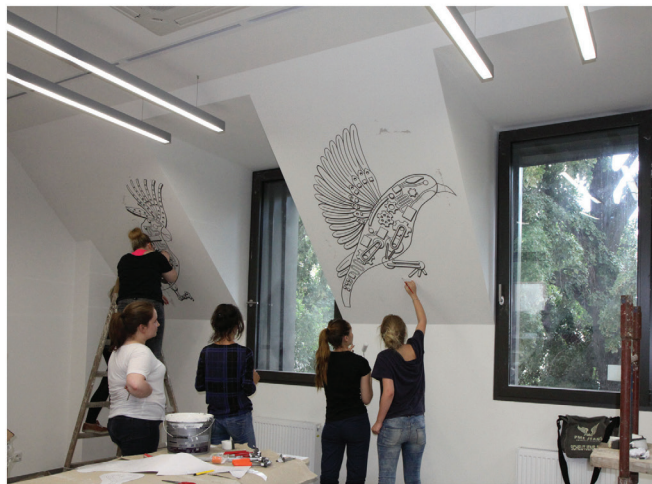
Il. 2. Katarzyna Kusińska, Mechaniczne ptaki , Biblioteka Wydziału Architektury PWr, ul. B. Prusa, Wrocław 2016 (fragment projektu i fragment muralu)